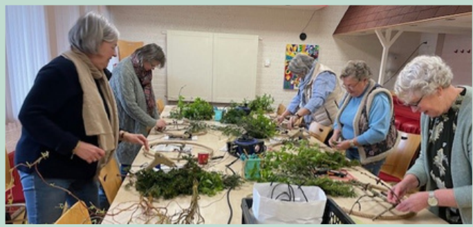
Een kijkje bij het Toon Hermans Huis (THH)

'Mensen worden vooral naar ons verwezen door de afdeling oncologie van Ziekenhuis Gelderse Vallei. Daarmee hebben we goed contact. Dit is niet de enige weg om ons te vinden. We maken ons zelf ook bekend via onze website en met informatiefolders. Steun van familie of vrienden is er niet altijd of niet voldoende. Mensen in hun omgeving staan er niet (altijd meer) voor open uit verlegenheid of onmacht. Mensen kunnen zich eenzaam voelen in hun ziekte. Collega's sturen nog eens een bloemetje, maar ondertussen zit je alleen thuis. Er kunnen vragen spelen over hoe je het leven weer oppakt en vertrouwen krijgt. Het praten met lotgenoten of met een vrijwilliger in Het THH kan dan helpen. Wij willen een warme deken voor de gasten zijn.'